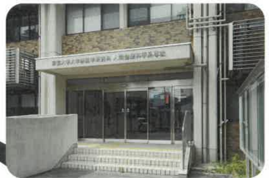
南正面玄関拡大写真

基本的には京都大学にて実施いたしますが、場合によっては お子さまが利用される事業所にて実施する場合もございます。